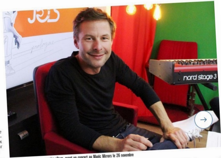
L'artiste havrais sort son premier album, avant un concert au Magic Mirrors le 26 novembre

Avez-vous réellement l'angoisse de la page blanche ? Je fais référence à votre chanson « Moi j'marche à toi » et à « Docteur » où vous vous plaignez de ne plus trouver l'inspiration. « Ces deux chansons sont dans l'autodérision. La première explique que l'on peut trouver l'inspiration dans le quotidien et la deuxième parle du fait que je ne sais pas faire de vraies chansons d'amour. Réellement, je n'ai pas peur de la page blanche. Si cela ne vient pas, il faut passer à autre chose. »