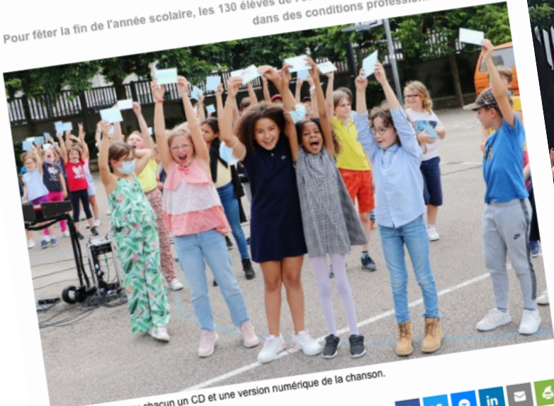
Les enfants ont reçu chacun un CD et une version numérique de la chanson.

Pour fêter la fin de l'année scolaire, les 130 élèves de l'école Bellanger du Havre ont interprété une chanson originale, qu'ils ont enregistrée dans des conditions professionnelles. Musique !