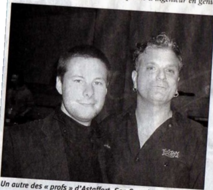
Un autre des « pros » d'Astaffort, San Severino