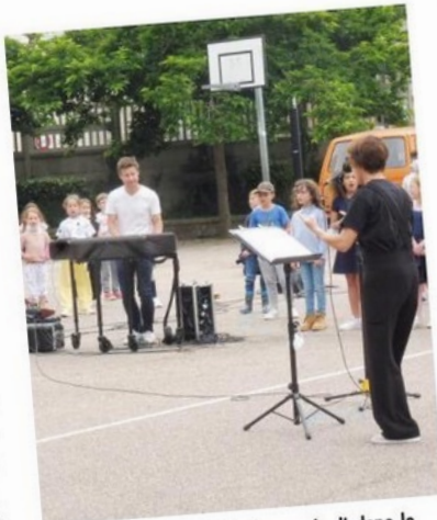
Cinq classes étaient réunies vendredi dans la cour de l'école